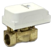
1 électrovanne autonome wireless Strega