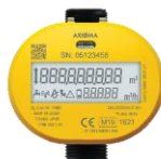
1 compteur d'eau Axioma Qalcosonic