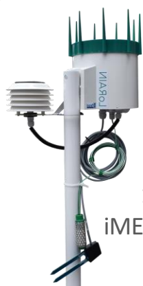
1 station iMETOS LoRAIN PESSL